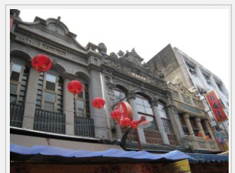
洋樓式建築拱形窗洞